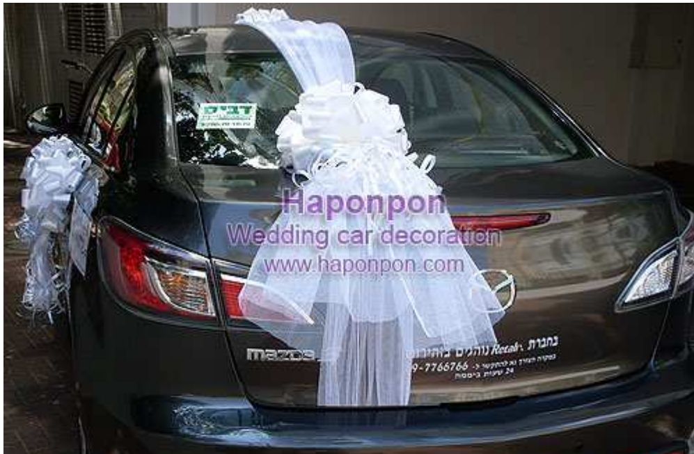
קישוט רכב מסוג טריו בד – פרטים נוספים באתר "הפונפון"