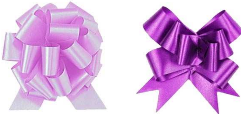
סרטי משיכה לאחר שנפתחו לצורת פונפון

איך יוצרים את הפונפון? ביד אחת החזיקו את שתי הרצועות וביד השנייה את הסרט. כעת משכו מטה את הרצועות כך שביד השנייה תיווצר צורה של פונפון. מתחו בעדינות את הרצועות, קשרו אותן זו לזו בחלק הקרוב לפונפון. זהו, קיבלתם פונפון. עשו כך עם כל סרטי המשיכה שרכשתם.