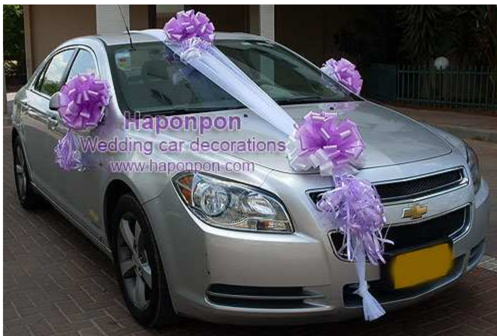
קישוט רכב מסוג קלאסיק – פרטים נוספים באתר "הפונפון"