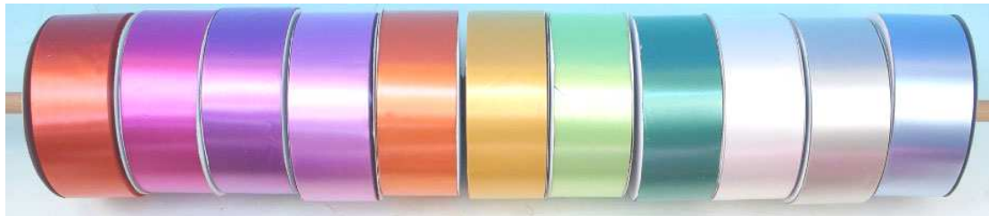
מגוון צבעים של סרטי קישוט ברוחב 5 ס"מ

"הפונפון" משתמש בחומרי גלם איכותיים ומייצר מהם קישוטי רכב מצוינים ועמידים בנסיעה, ולמרות זאת, המחירים שאנו רוכשים את חומרי הגלם, סבירים בהחלט. אנחנו עובדים עם מספר מצומצם של ספקים. אם תקלידו בגוגל תוכלו למצוא מגוון ספקים באזור מגוריכם.