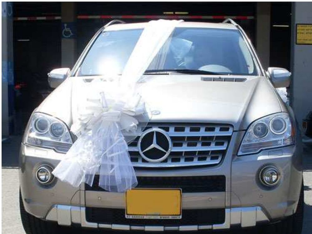
קישוט רכב מסוג רומנטיק – פרטים נוספים באתר "הפונפון"

רוב האנשים חושבים שיש צורך בהשקעה גדולה של כסף כדי להקים עסק. הם טועים. אין צורך בקופה גדולה של מזומנים כדי להקים עסק. חשוב יותר להתבסס על תוכנית מוכחת ופועלת מאשר להשקיע כסף רב בהרפתקאות עסקיות מסוכנות. אני לא יודע אם אתה עובד היום כשכיר במשרה מלאה, שכיר במשרה חלקית, עצמאי, חסר עבודה, סטודנט או כל אפשרות אחרת, מה שחשוב זה שאתה יכול ללמוד מקצוע ייחודי שיכול להפוך לעיסוק עיקרי ולייצר לך הכנסה סבירה.