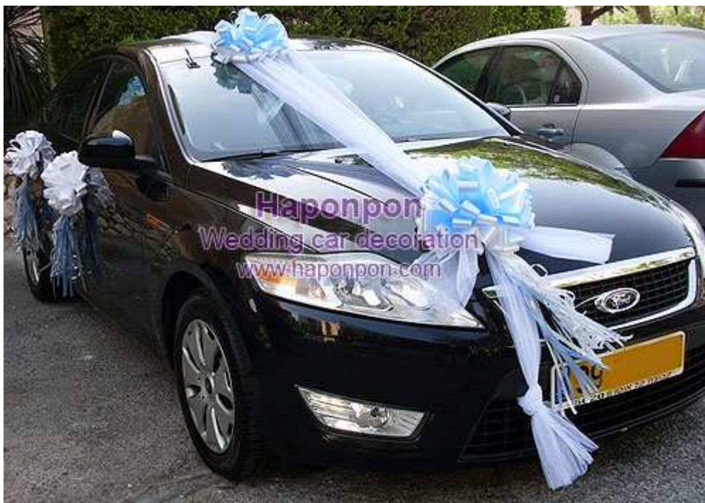
קישוט רכב מסוג טריו בד – פרטים נוספים באתר "הפונפון"