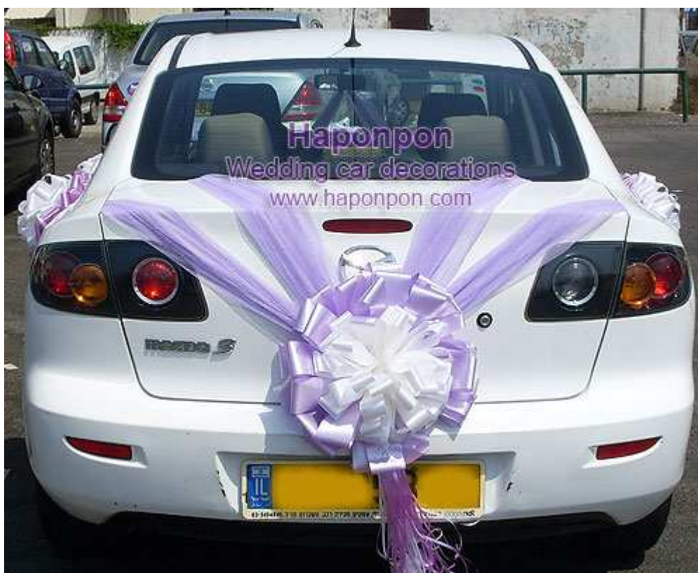
קישוט רכב מסוג ונוס דאבל – פרטים נוספים באתר "הפונפון"