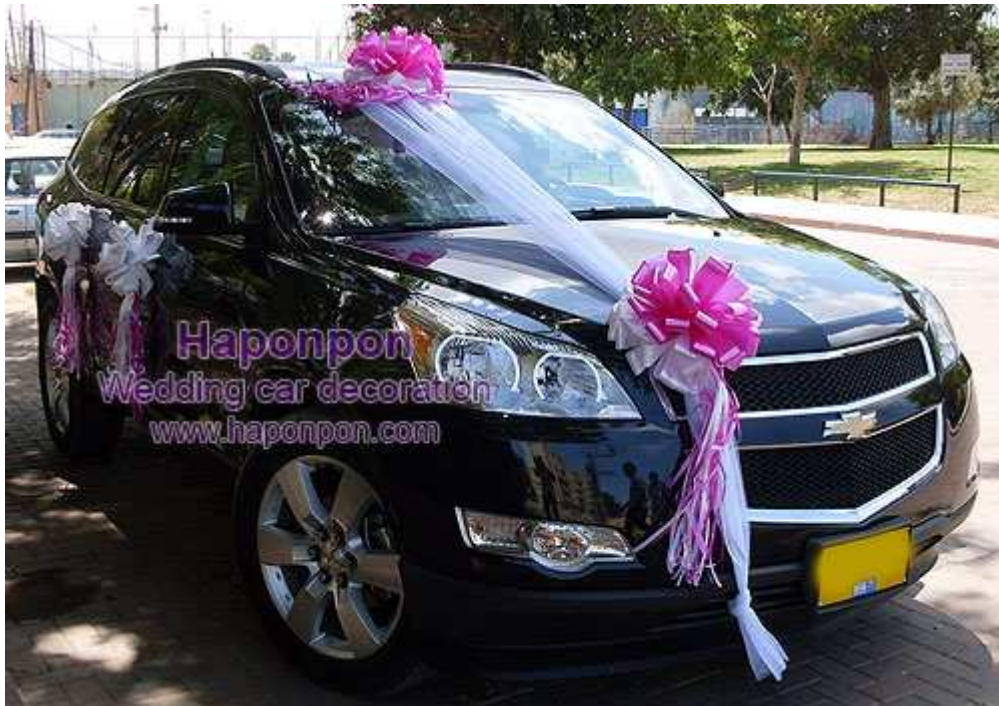
קישוט רכב מסוג טריו בד – פרטים נוספים באתר "הפונפון"

כעת, לאחר שהשלמתם את חיבור הקישוטים לרכב, בדקו שכל מרכיבי הקישוט קשורים היטב. אל תשכחו לבקש מהנהג לנסוע באופן מתון ולא לעבור את מהירות 90 קמ"ש.