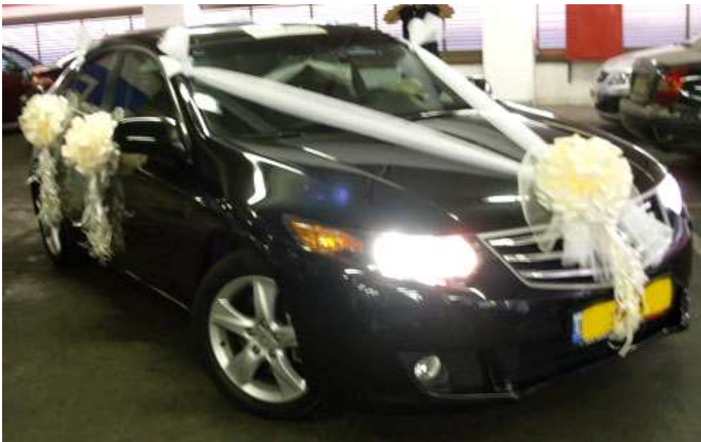
קישוט רכב מסוג רומנטיק ונוס – פרטים נוספים באתר "הפונפון"