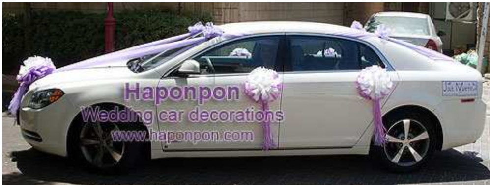
קישוט רכב ונוס – פרטים נוספים באתר "הפונפון"

"הפונפון" משתמש בחומרים איכותיים לייצור קישוטי הרכב ובשיטות התקנה שאינן פוגעות וגורמות נזק לרכבים. "הפונפון" משווק זיכיונות, ספרי הדרכה ותוכניות הדרכה לקישוט רכב לחתונה גם בחו"ל.