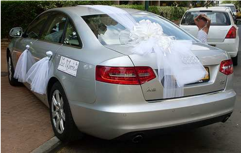
קישוט רכב מסוג רומנטיק גאלה – פרטים נוספים באתר "הפונפון"