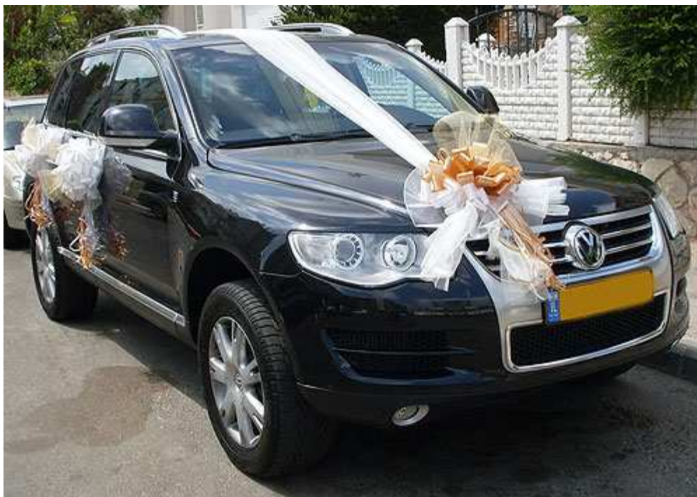
קישוט רכב מסוג רומנטיק – פרטים נוספים באתר "הפונפון"