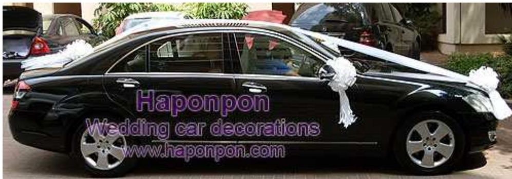
קישוט רכב מסוג קלאסיק – פרטים נוספים באתר "הפונפון"