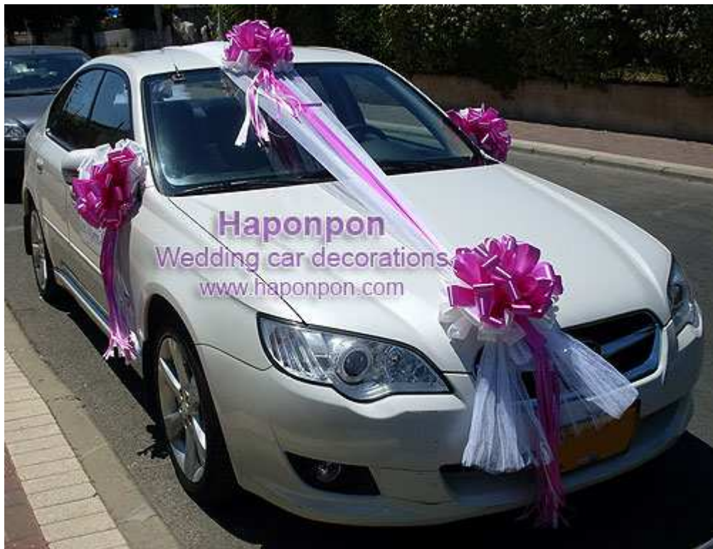
קישוט רכב מסוג קלאסיק – פרטים נוספים באתר "הפונפון"

הקמת עסק לקישוט רכב לחתונה כמו "הפונפון" היא דרך טובה ליצור מקור הכנסה משלך. ההצלחה ביישום המידע בתוכנית ובהקמת עסק מצליח תלויה ביכולת, בכישרון, במצב השוק, בהתמדה שלך ובפעולות שתנקוט. תוכנית ההכשרה שלנו אינה מתיימרת להפוך אותך למיליונר. התוכנית מציגה את המידע הנחוץ להקים עסק לקישוט מכוניות לחתונה. ההצלחה של העסק תלויה כבר בך.