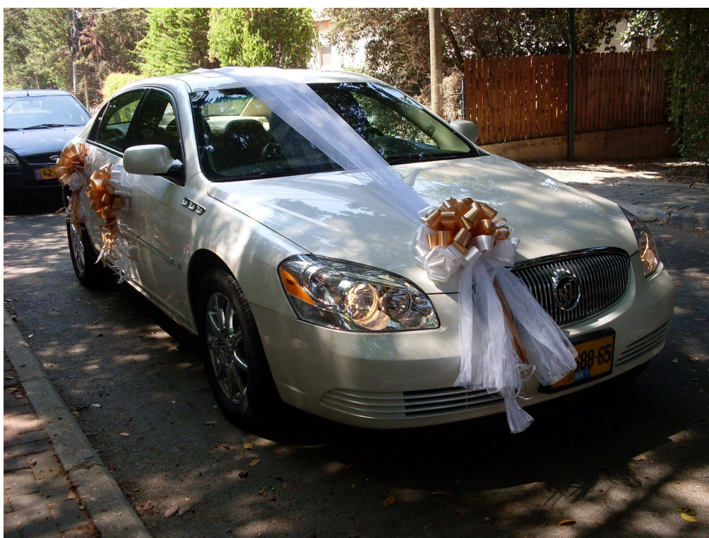
קישוט רכב מסוג רויאל – פרטים נוספים באתר "הפונפון"