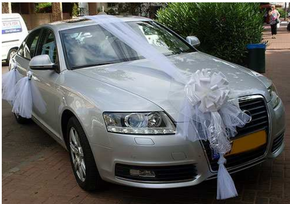
קישוט רכב מסוג רומנטיק גאלה – פרטים נוספים באתר "הפונפון"