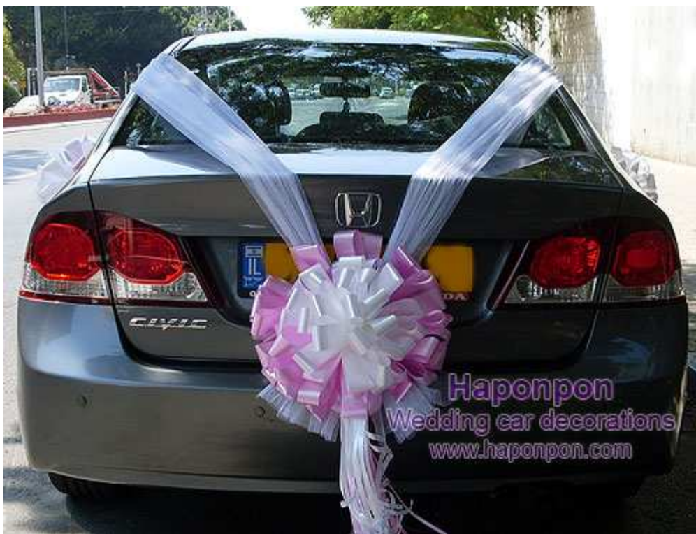
קישוט רכב מסוג ונוס – פרטים נוספים באתר "הפונפון"