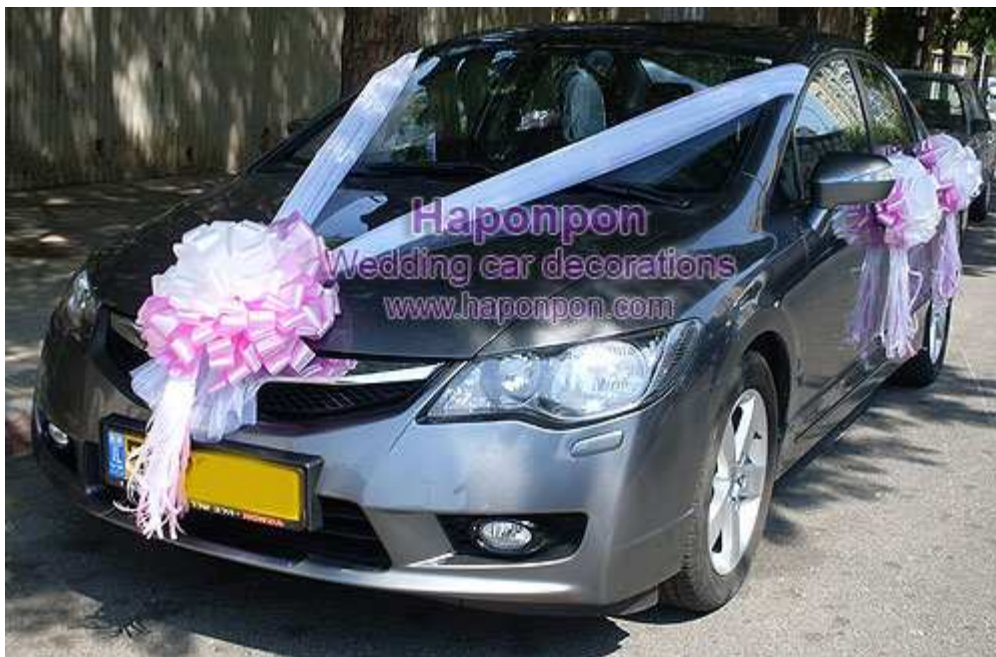
קישוט רכב מסוג ונוס – פרטים נוספים באתר "הפונפון"