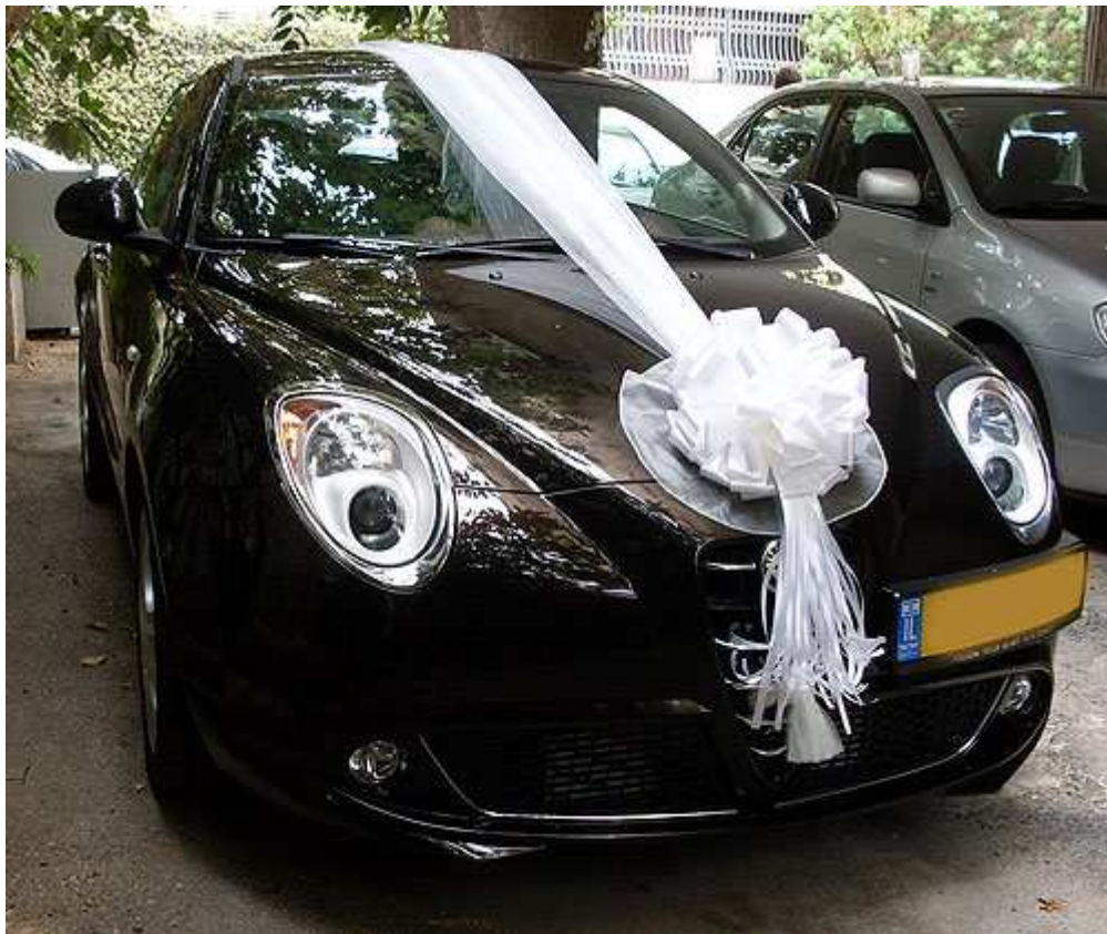
קישוט רכב רומנטיק גאלה – פרטים נוספים באתר "הפונפון"

בשלב ראשון פתחו את אריזת סרט הקישוט והניחו אותו בצד. אם תרצו להשתמש בשני צבעים בקישוט שלכם, מומלץ לרכוש שני גלילים, כל אחד בצבע אחר.