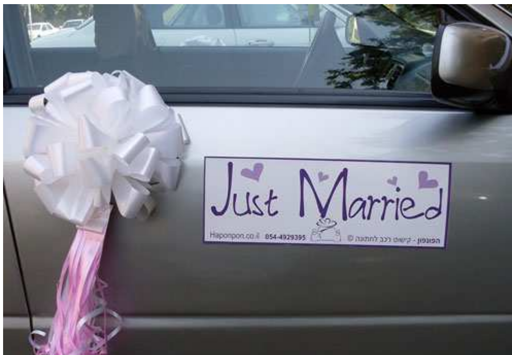
חינם - שלט מגנט מתנה לכל קישוט בבית הלקוח – פרטים נוספים באתר "הפונפון"