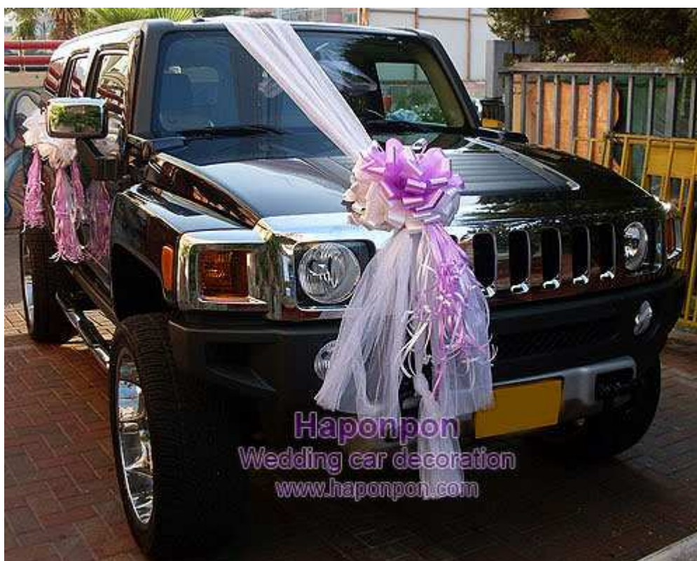
קישוט רכב מסוג טריו האמר – פרטים נוספים באתר "הפונפון"